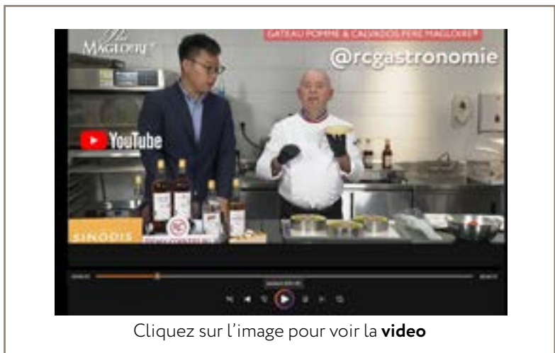
Cliquez sur l'image pour voir la video